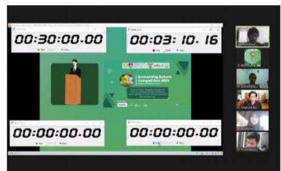
Accounting Debate Competition (ADC)