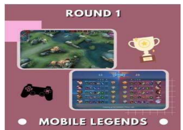
Pekan Olahraga dan Seni Jurusan Akuntansi (POSJA)