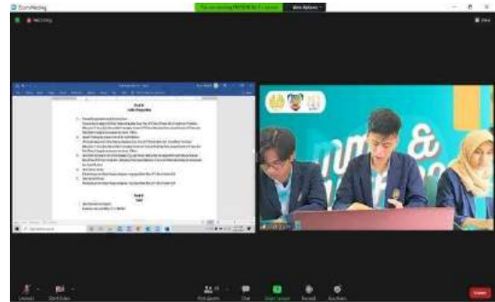
Rapat Kerja 2021