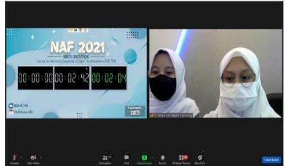
National Accounting Fest (NAF)