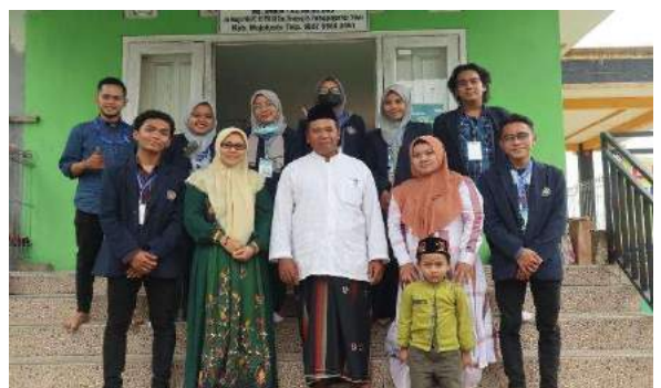
Akuntansi Abdi Desa (AKUBISA)