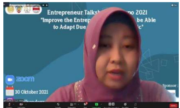
Entrepreneur Talkshow and Expo