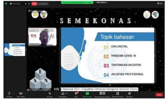
Seminar Ekonomi Nasional (SEMEKONAS)