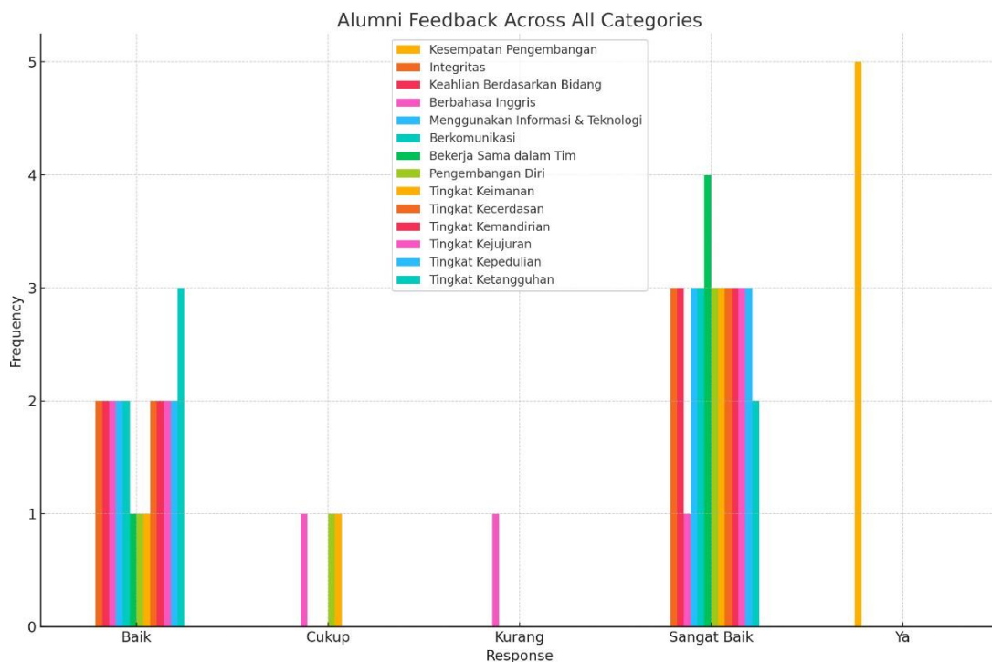
Graphic 2 Alumni Feedback Across All Categories

Akhirnya, umpan balik alumni berkontribusi pada pengembangan pendekatan pembelajaran yang inovatif dan metodologi pengajaran. Di era di mana praktik bisnis berkembang pesat karena teknologi, globalisasi, dan perubahan perilaku konsumen, kemampuan untuk mengadaptasi praktik pendidikan dengan perubahan ini sangat penting. Alumni yang terlibat langsung dalam transformasi ini berada dalam posisi yang tepat untuk memberikan saran mengenai cara mengintegrasikan teknologi baru, soft skill, dan strategi bisnis ke dalam kurikulum. Umpan balik mereka membantu fakultas untuk tetap berpikiran maju dan proaktif dalam mempersiapkan mahasiswa untuk menghadapi tantangan di masa depan. Oleh karena itu, umpan balik alumni tidak hanya merupakan cerminan dari kesuksesan masa lalu tetapi juga merupakan elemen kunci dalam membentuk masa depan program S1 Bisnis Digital di FEB UNESA.