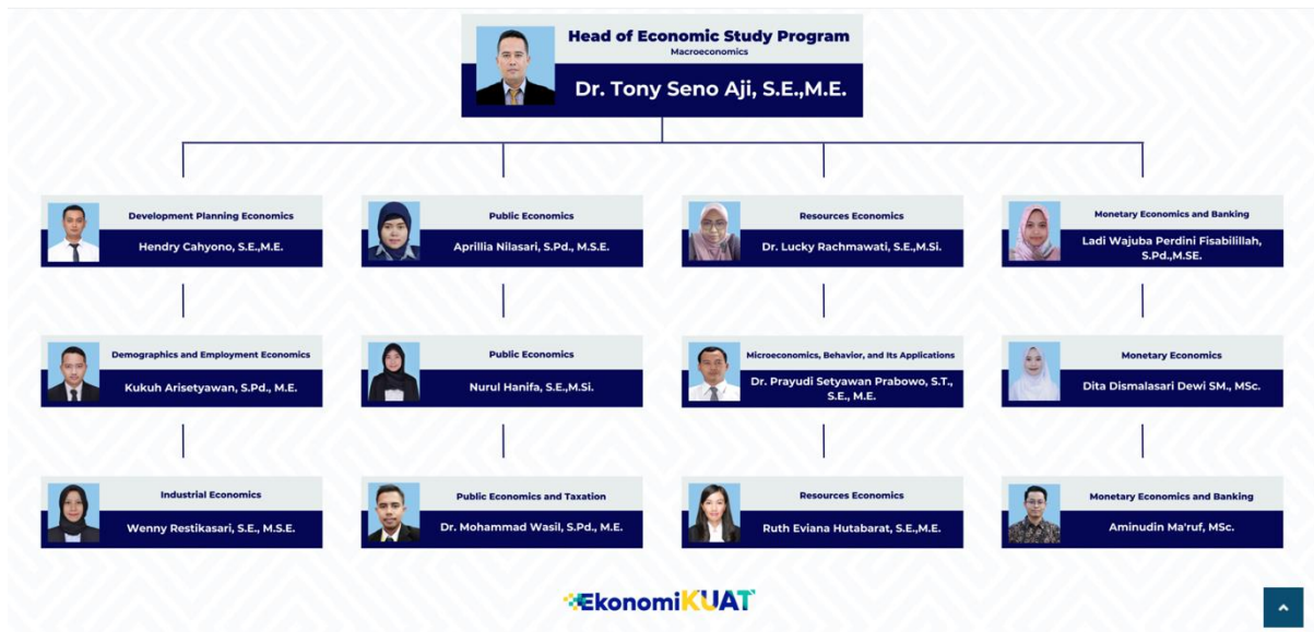
Gambar 3.1 Struktur Organisasi Program Studi S1 Ekonomi

Gambar diatas dapat terlihat struktur organisasi yang ada di level program studi S1 Ekonomi. Prodi S1 Ekonomi dipimpin oleh Koordinator Program Studi, yang dibawahnya terdapat beberapa tim structural seperti, tim kurikulum, tim unit penjaminan mutu (UPM), tim pengelola pusat studi. Jumlah dosen yang dimiliki oleh prodi S1 Ekonomi terdapat 14 dosen.