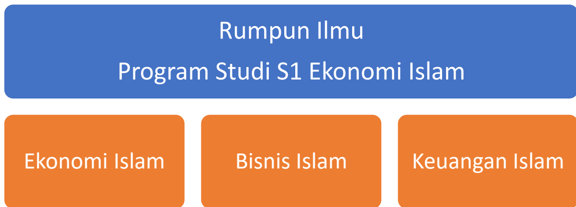
Bagan 2.1: Pohon Rumpun Keahlian Program Studi S1 Ekonomi Islam

CPL-9 Mampu mengaplikasikan keilmuan Ekonomi Islam, Bisnis Islam, dan Keuangan Islam dalam penyelesaian permasalahan dengan memanfaatkan IPTEKS.