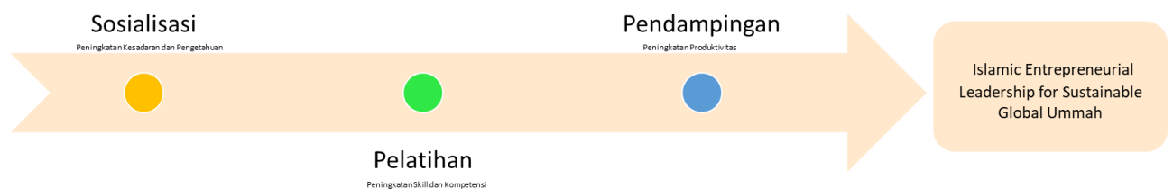
Bagan 3.3: Roadmap PkM Program Studi S1 Ekonomi Islam

Pengabdian kepada Masyarakat Program Studi Ekonomi Islam dilaksanakan pada bidang Keuangan Islam, Bisnis Islam dan Ekonomi Islam sesuai dengan Visi Program Studi sebagaimana pada gambar berikut.