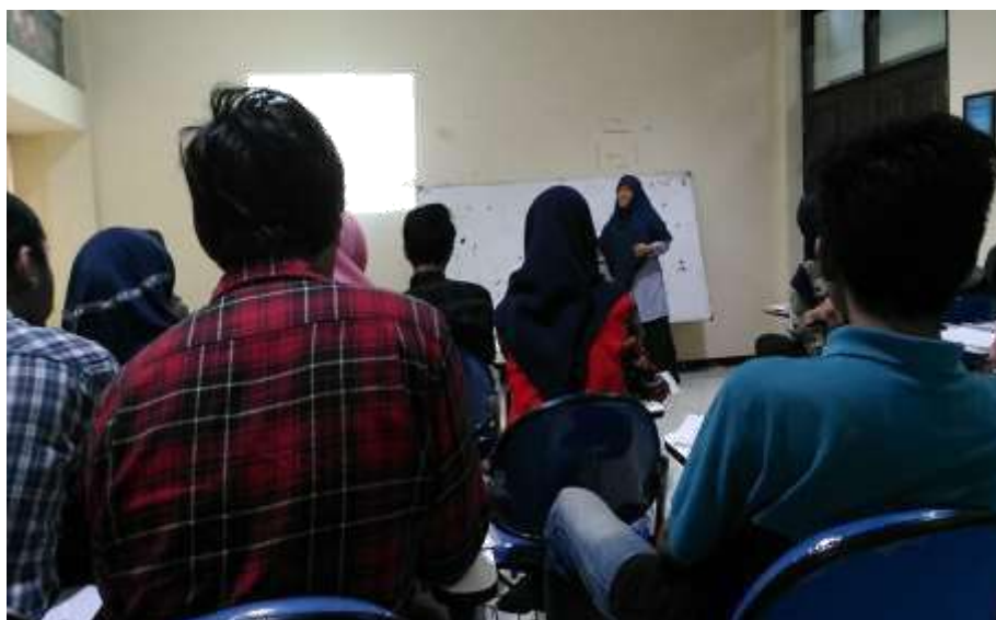
Gambar 18. Monev pembelajaran mata kuliah Inovatif 2 di Prodi S1 Pendidikan Geografi