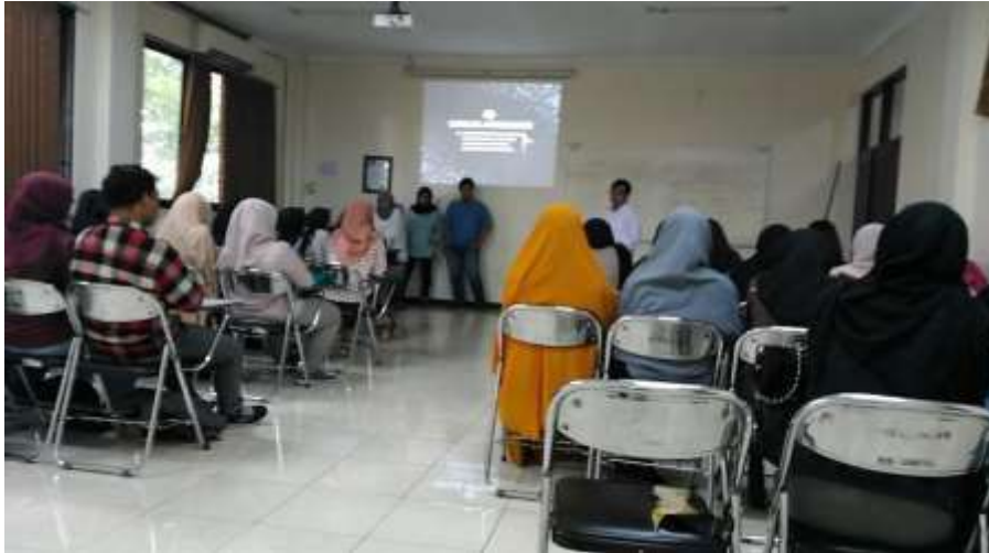
Gambar 1. Pembelajaran mata kuliah Hukum dan Etika Media Massa di Prodi S1 Ilmu Komunikasi