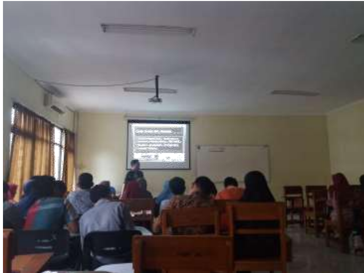
Gambar 16. Pembelajaran mata kuliah inovatif di Prodi S1 Geografi