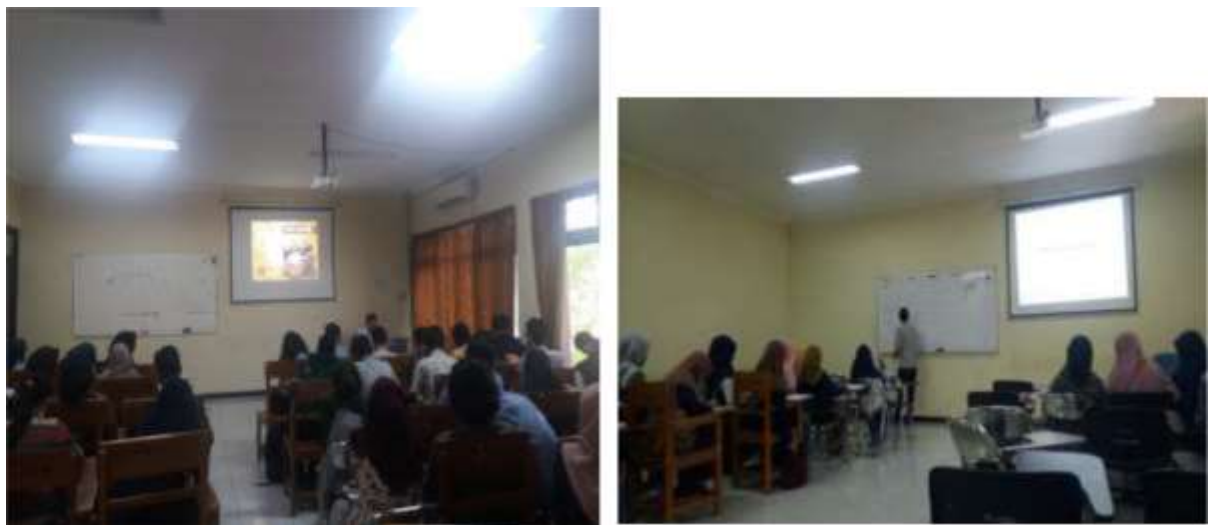
Gambar 5. Pembelajaran mata kuliah Teori Belajar Kognitif di Prodi S1 Sejarah