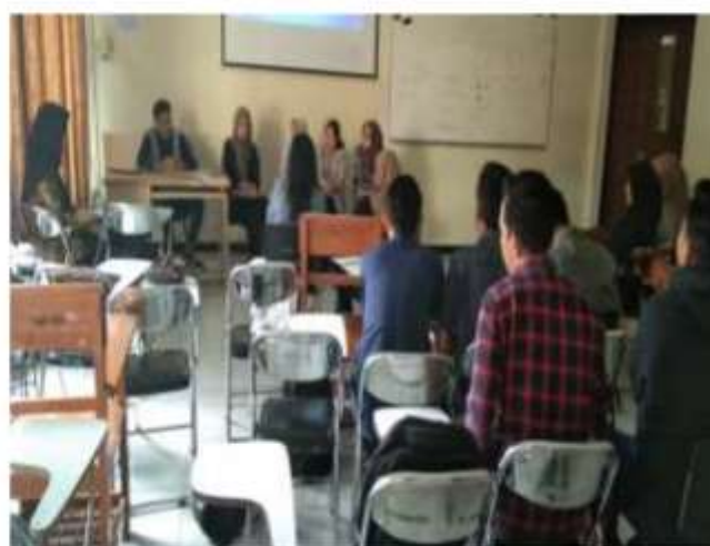
Gambar 19. Pembelajaran mata kuliah Kewirausahaan di Prodi S1 Sosiologi