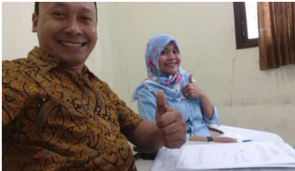
Gambar 15. Monev pembelajaran mata kuliah di Prodi S1 AN