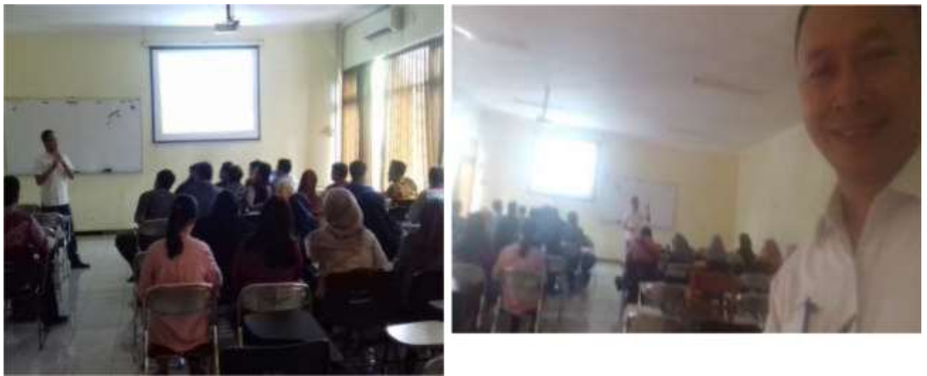
Gambar 4. Pembelajaran mata kuliah Filsafat sejarah