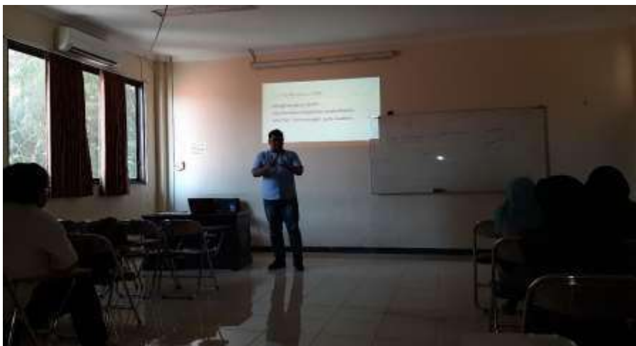
Gambar 2. Pembelajaran mata kuliah komunikasi organisasi di Prodi S1 Ilmu Komunikasi