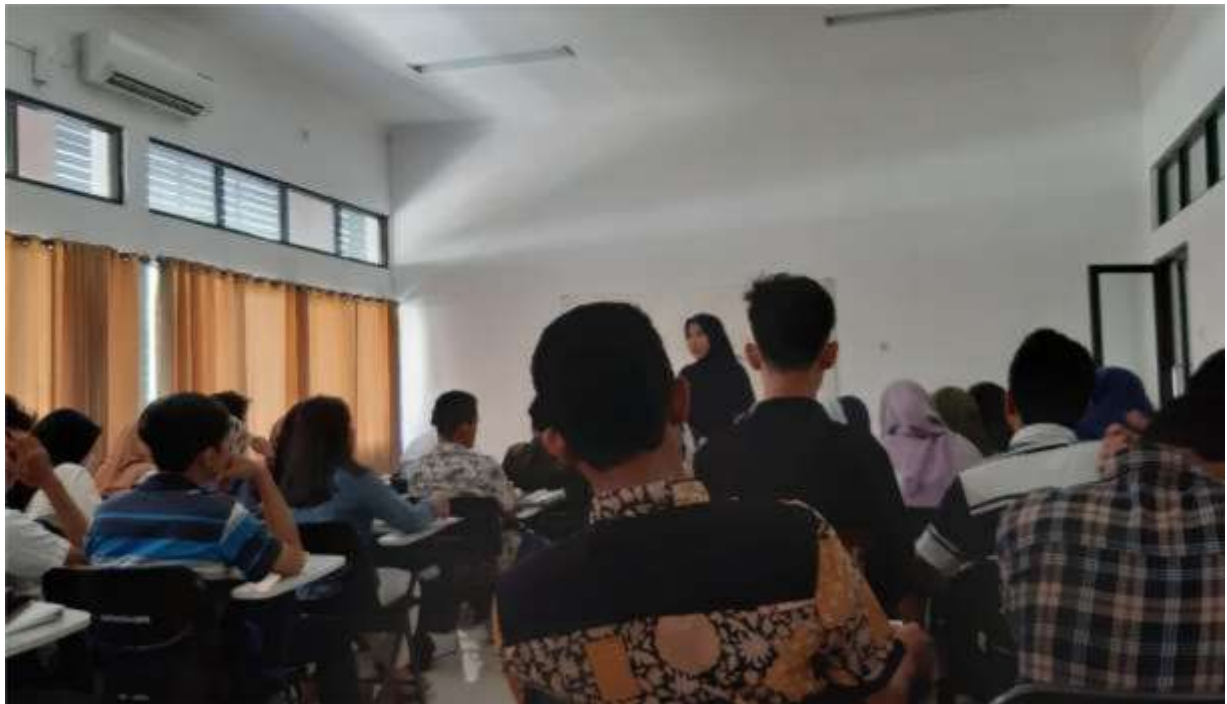
Gambar 10. Monev pembelajaran mata kuliah Tindak Pidana dalam KUH di Prodi S1 Ilmu Hukum