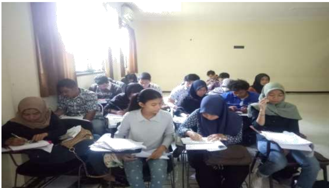
Gambar 3. Pembelajaran mata kuliah Analisis Jabatan di D3 Administrasi Negara