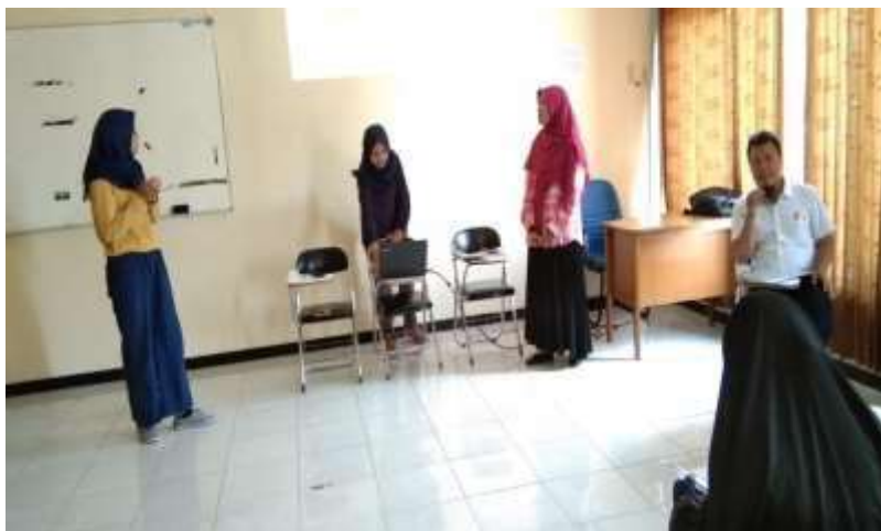
Gambar 21. Pembelajaran mata kuliah Sosiologi Politik di Prodi S1Sosiologi