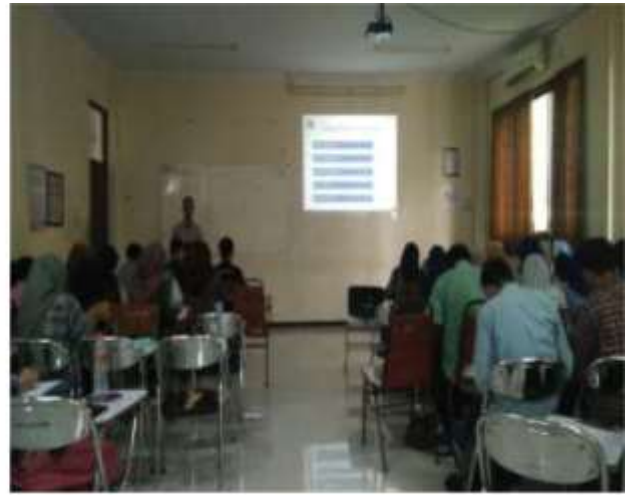
Gambar 14. Pembelajaran mata kuliah Etika Administrasi di Prodi S1 AN