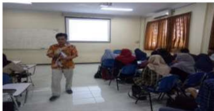
Gambar 7. Pembelajaran mata kuliah di Prodi PMPKn