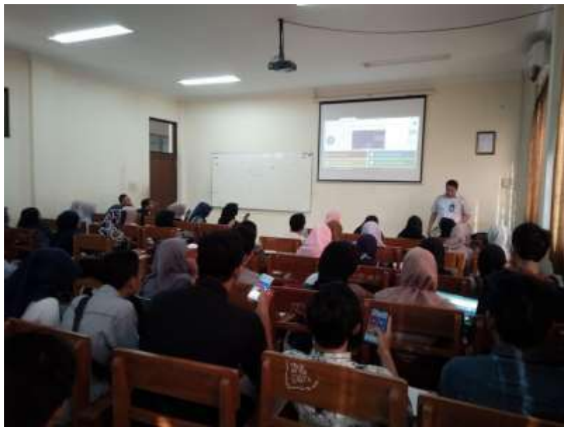
Gambar 17. Pembelajaran mata kuliah Inovatif 2 di Prodi S1 Pendidikan Geografi.