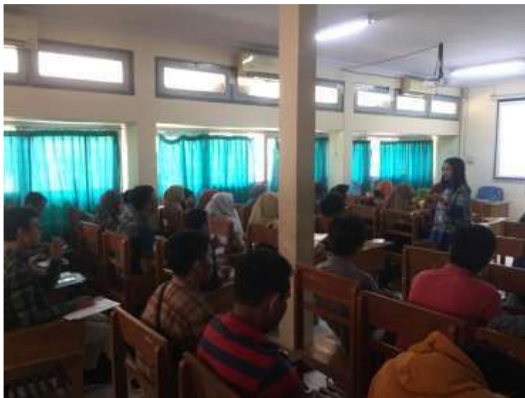
Gambar 12. Monev pembelajaran mata kuliah di Prodi S1 AN