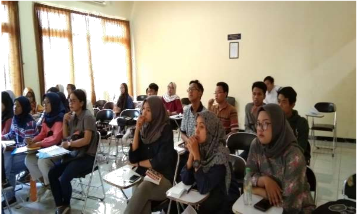
Gambar 11. Pembelajaran mata kuliah Hukum Jaminan di Prodi S1 Hukum