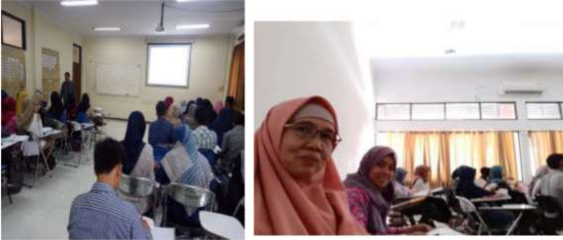
Gambar 9. Monev pembelajaran mata kuliah di Prodi Hukum