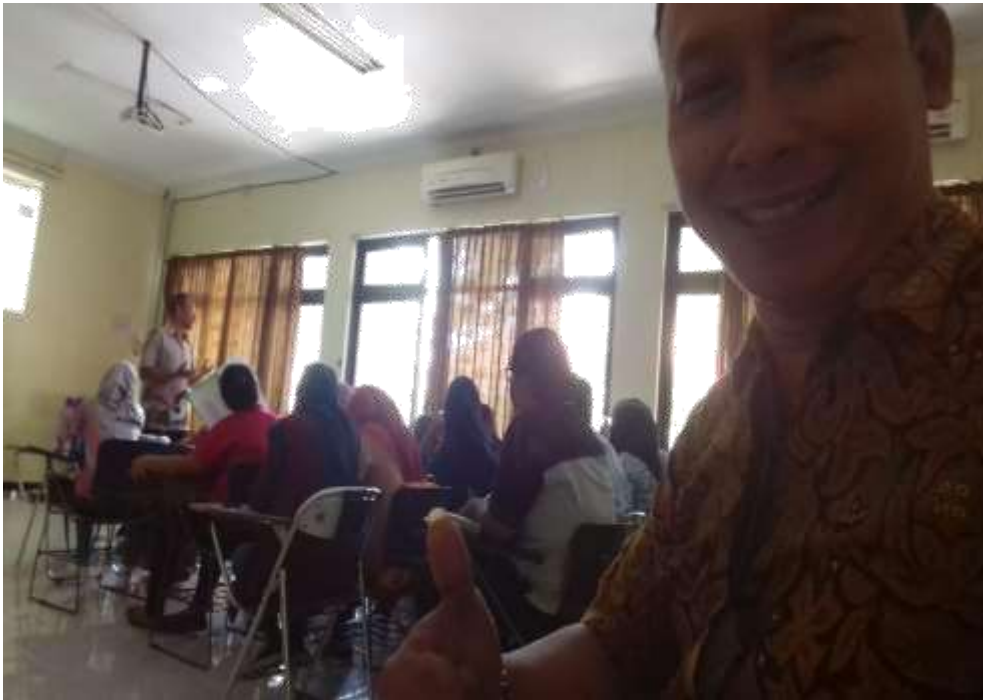
Gambar 20. Monev pembelajaran mata kuliah Kewirausahaan di Prodi S1 Sosiologi