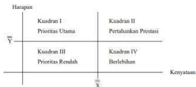
Gambar 3.3. Diagram Kartesius (Supranto, 2001)

Analisis kuadran atau Importance Performance Analysis (IPA) adalah sebuah teknik analisis deskriptif yang digunakan untuk mengidentifikasi faktor-faktor kinerja penting apa yang harus ditunjukkan oleh suatu organisasi dalam memenuhi kepuasan parapengguna jasa mereka (konsumen). Secara umum, model diagram kuadran dapat ditunjukkan pada gambar 3.3.