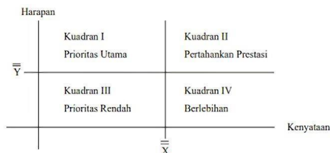
Gambar 3.3. Diagram Kartesius (Supranto, 2001)

Analisis kuadran atau Importance Performance Analysis (IPA) adalah sebuah teknikanalisis deskriptif yang digunakan untuk mengidentifikasi faktor-faktor kinerja penting apayang harus ditunjukkan oleh suatu organisasi dalam memenuhi kepuasan para pengguna jasa mereka (konsumen). Secara umum, model diagram kuadran dapat ditunjukkan pada gambar berikut: