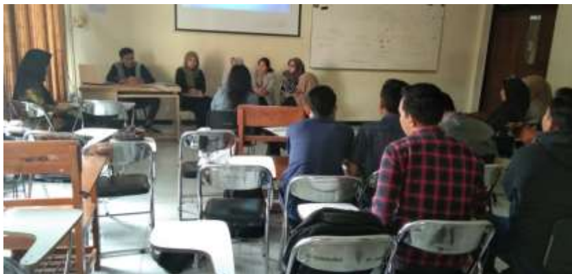
Gambar 19. Pembelajaran mata kuliah Kewirausahaan di Prodi S1 Sosiologi