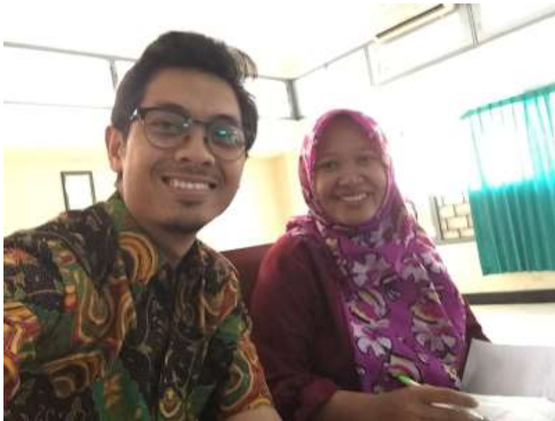
Gambar 13. Monev pembelajaran mata kuliah Studi Implementasi di Prodi S1 Administrasi Negara