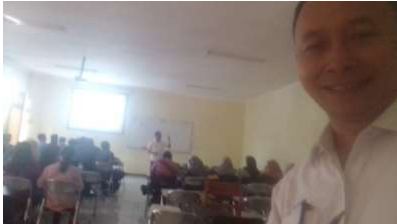
Gambar 5. Pembelajaran mata kuliah Filsafat Sejarah di Prodi S1 Sejarah