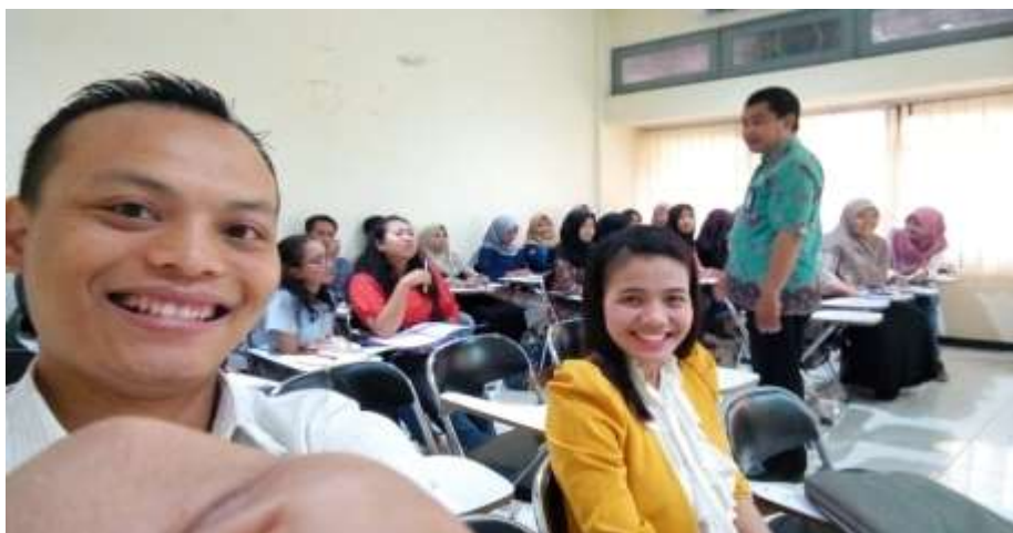
Gambar 2. Pembelajaran mata kuliah Pendidikan Multikultur