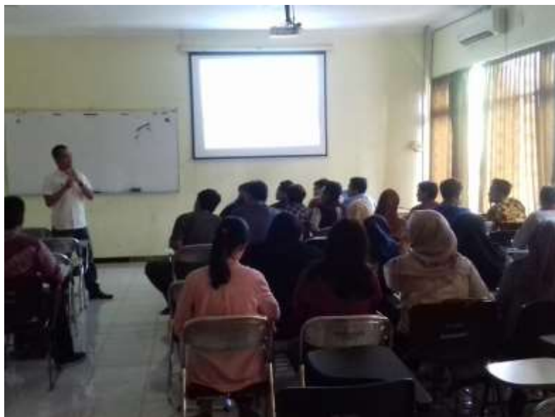
Gambar 4. Pembelajaran mata kuliah Filsafat sejarah