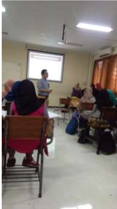
Gambar 7. Pembelajaran mata kuliah di Prodi PMPKn