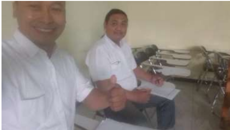
Gambar 9. Monev pembelajaran mata kuliah Sosiologi Politik di Prodi S1Sosiologi