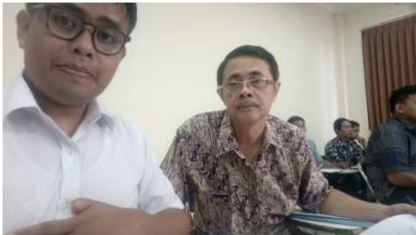
Gambar 6. Monev pembelajaran mata kuliah Teori Ilmu Geografi di Prodi S1 PIPS