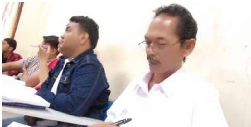
Gambar 10. Monev pembelajaran mata kuliah Hukum Laut Internasional di Prodi S1 Ilmu Hukum