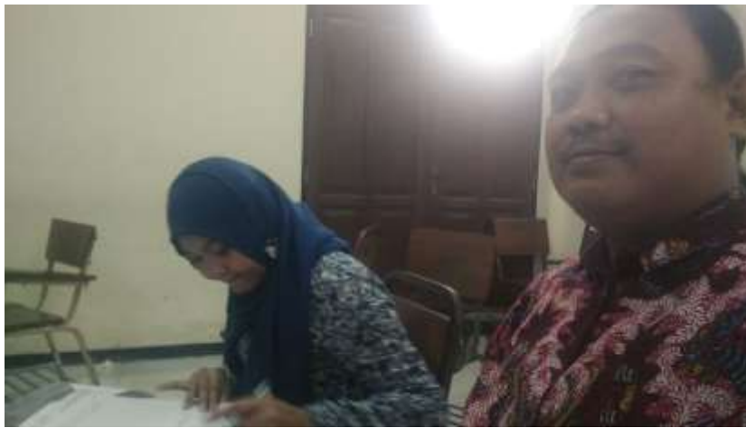
Gambar 15. Monev pembelajaran mata kuliah Teori Organisasi di Prodi S1 AN