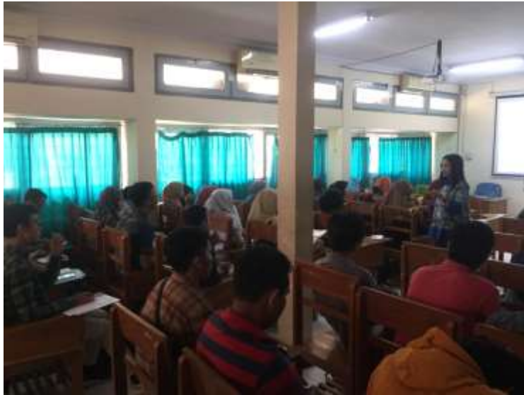
Gambar 11. Monev pembelajaran mata kuliah Studi Implementasi di Prodi S1 AN