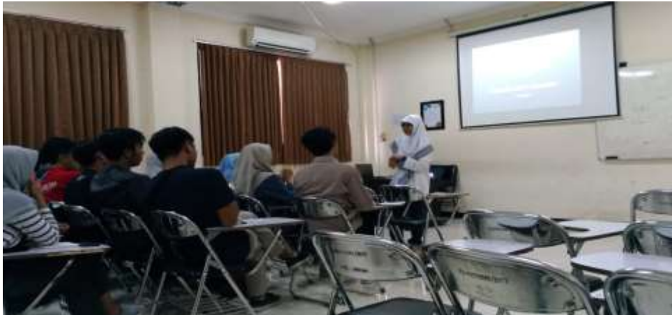
Gambar 1. Pembelajaran mata kuliah Gender dan Media di Prodi S1 Ilmu Komunikasi