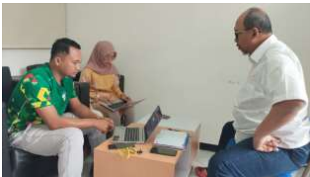
Audit S2 IKOR