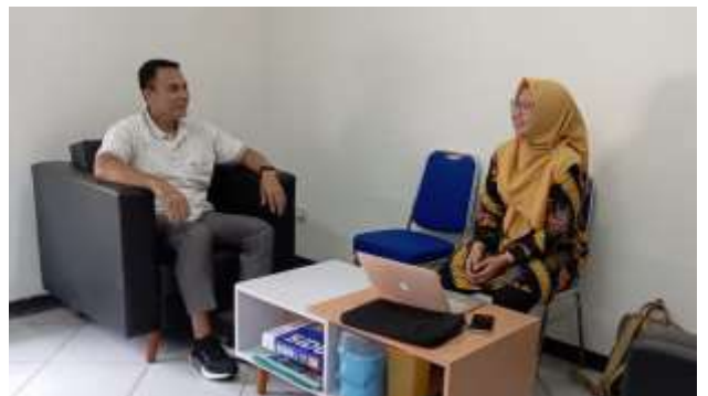
Audit S1 PKO