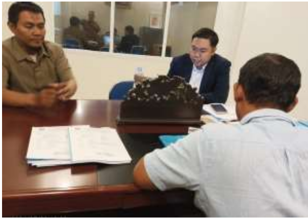
Audit S1 IKOR