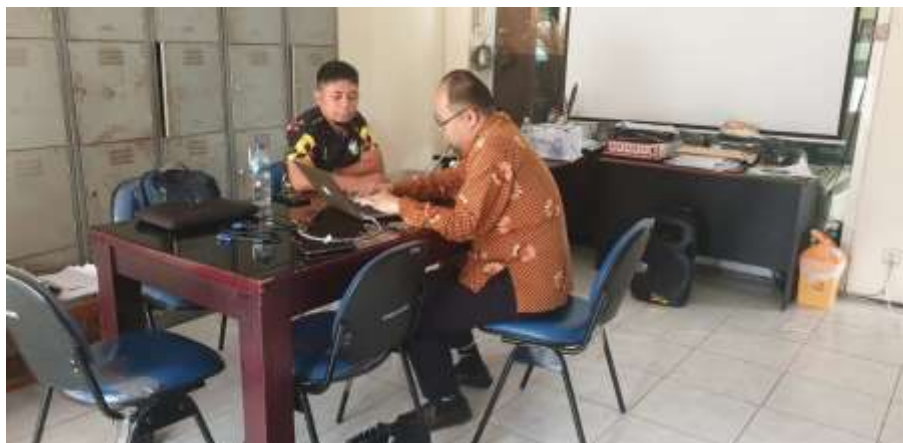
Audit S3 IKOR