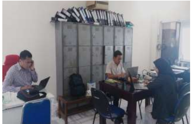
Audit S1 PKO