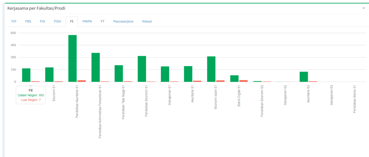
Gambar 2 – Jumlah Kerjasama tiap Program Studi di FEB Unesa

119 kerjasama luar negeri. Berikut adalah data Kerjasama yang telah dilakukan oleh Program Studi selingkung Fakultas Ekonomika dan Bisnis Unesa ditahun 2019-2023.