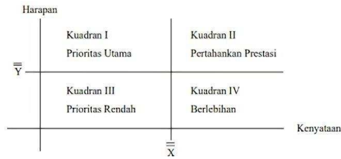
Gambar 3.1. Diagram Kartesius (Supranto, 2001)

Adapun interpretasi dari masing-masing kuadran pada gambar 3.3 dapat dijelaskan sebagai berikut :