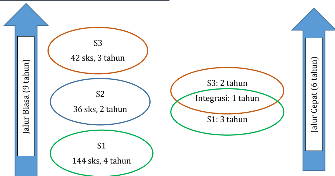
Gambar 2. Perbandingan Konsep Program Reguler dan Jalur Cepat S1 – S3