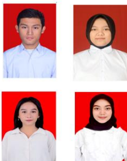
Contoh Pas Foto