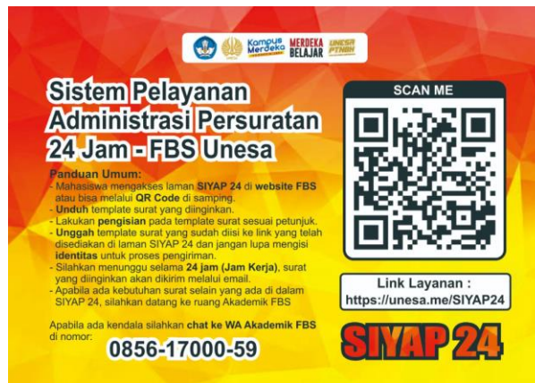
Gambar 1. Poster SIYAP 24

Permasalahan administrasi terkait persuratan untuk mahasiswa kerap kali tidak berjalan dengan efektif dikarenakan adanya proses birokrasi yang panjang khususnya di bidang akademik di fakultas. Oleh karena itu Fakultas Bahasa dan Seni (FBS) berinovasi dengan menyiapkan system untuk mempermudah mahasiswa dalam pengajuan persuratan seperti surat izin magang, pengurusan no sertifikat untuk kegiatan seminar, surat tugas, dan pengurusan surat penting lainnya. Sistem tersebut bernama SIYAP 24 (Sistem Layanan Administrasi Persuratan 24 Jam).