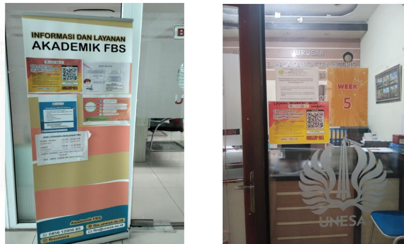
Gambar 2. Barcode SIYAP 24 di beberapa tempat

memilih menu SIYAP 24 tersebut atau dengan langsung klik https://fbs.unesa.ac.id/page/layanan-surat .