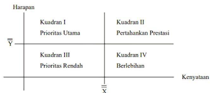
Gambar 3.3. Diagram Kartesius (Supranto, 2001)

Analisis kuadran atau Importance Performance Analysis (IPA) adalah sebuah teknik analisis deskriptif yang digunakan untuk mengidentifikasi faktor-faktor kinerja penting apa yang harus ditunjukkan oleh suatu organisasi dalam memenuhi kepuasan para pengguna jasa mereka (konsumen). Secara umum, model diagram kuadran dapat ditunjukkan pada gambar berikut: