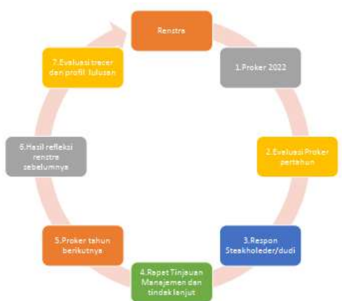
Gambar 1.2 Alur Pengembangan Renstra FMIPA

rencana strategis, tata kelola, evaluasi profil lulusan program studi (prodi), dan restrukturisasi kurikulum prodi. Pengembangan renstra FMIPA UNESA untuk tahun 2021-2025 seperti disajikan pada Gambar 1.2 .