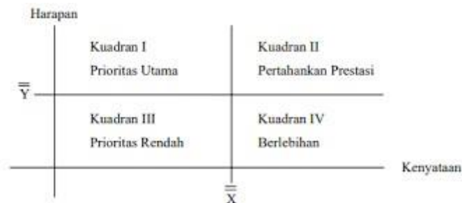
Gambar 3.3. Diagram Kartesius (Supranto, 2001)

Analisis kuadran atau Importance Performance Analysis (IPA) adalah sebuah teknik analisis deskriptif yang digunakan untuk mengidentifikasi faktor-faktor kinerja penting apa yang harus ditunjukkan oleh suatu organisasi dalam memenuhi kepuasan para pengguna jasa mereka (konsumen). Secara umum, model diagram kuadran dapat ditunjukkan pada Gambar 3.3.