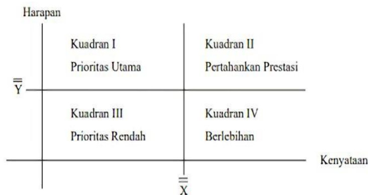
Gambar 3.3. Diagram Kartesius (Supranto, 2001)

Analisis kuadran atau Importance Performance Analysis (IPA) adalah sebuah teknik analisis deskriptif yang digunakan untuk mengidentifikasi faktor-faktor kinerja penting apa yang harus ditunjukkan oleh suatu organisasi dalam memenuhi kepuasan para pengguna jasa mereka (konsumen). Secara umum, model diagram kuadran dapat ditunjukkan pada gambar berikut: