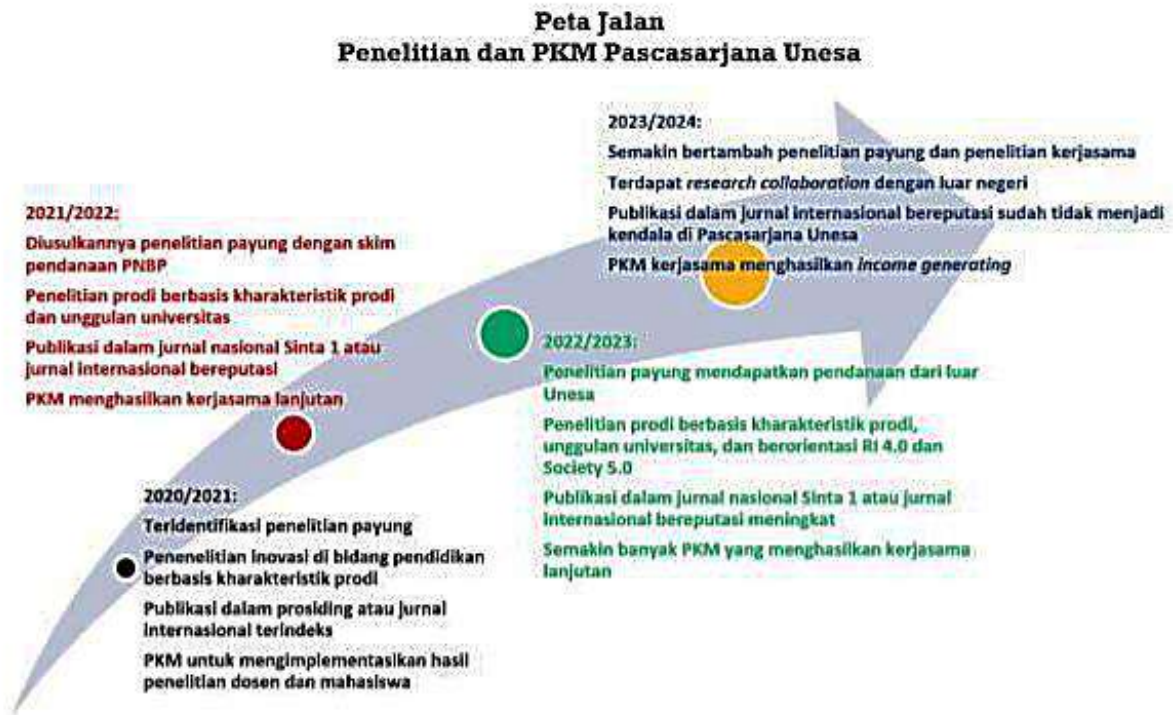
Gambar 7.2.1.1 Roadmap Penelitian dan PKM Pascasarjana Unesa

Peta jalan penelitian atau Roadmap Pascasarjana Unesa (lihat Gambar 7.2.1.1) sudah menaungi penelitian dosen dan mahasiswa Prodi S2 Pascasarjana Unesa khususnya S2 Pendidikan Sains, yaitu adanya tema tentang keilmuan Pendidikan Sains. Peta jalan penelitian disajikan pada gambar 7.2.1.2.