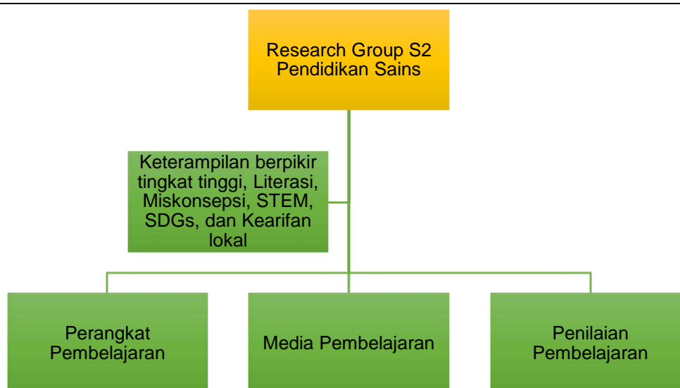
Gambar 7.2.1.3 Research Group S2 Pendidikan Sains

Pelaksanaan kegiatan penelitian yang dilakukan berdasarkan Pedoman Penelitian Universitas Negeri Surabaya yang diterbitkan oleh Lembaga Penelitian dan Pengabdian kepada Masyarakat Tahun 2021-2025. Pedoman ini memuat penjelasan skim penelitian yang ditawarkan internal Unesa, persyaratan, pendanaan, dan sistematika dokumen penelitian. Penelitian yang dilakukan di Pasca Sarjana S2 Pendidikan Sains meliputi perencanaan, pelaksanaan, pemantauan, dan pelaporan. Kegiatan penelitian pada Prodi S2 Pendidikan Sains Unesa didasarkan pada hal-hal tersebut di atas dan mengoptimalkan sumber daya baik internal maupun eksternal, yang dijabarkan secara ringkas sebagai berikut.