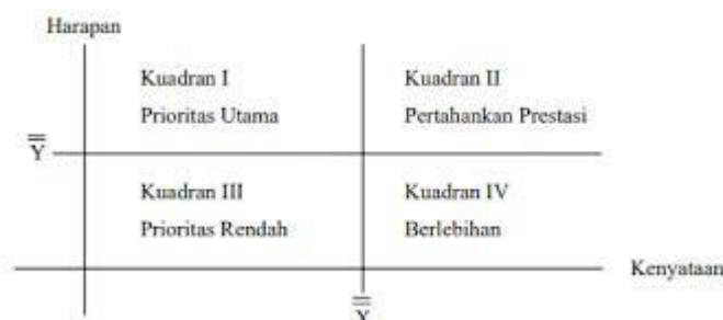
Gambar 3.3. Diagram Kartesius (Supranto, 2001)

Analisis kuadran atau Importance Performance Analysis (IPA) adalah sebuah teknik analisis deskriptif yang digunakan untuk mengidentifikasi faktor-faktor kinerja penting apa yang harus ditunjukkan oleh suatu organisasi dalam memenuhi kepuasan para pengguna jasa mereka (konsumen). Secara umum, model diagram kuadran dapat ditunjukkan pada gambar 3.3.