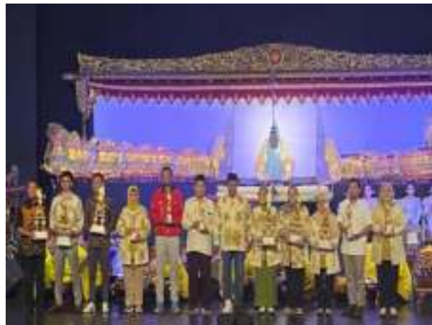
Gambar 3. 6 Peringkat I Lomba Pantun