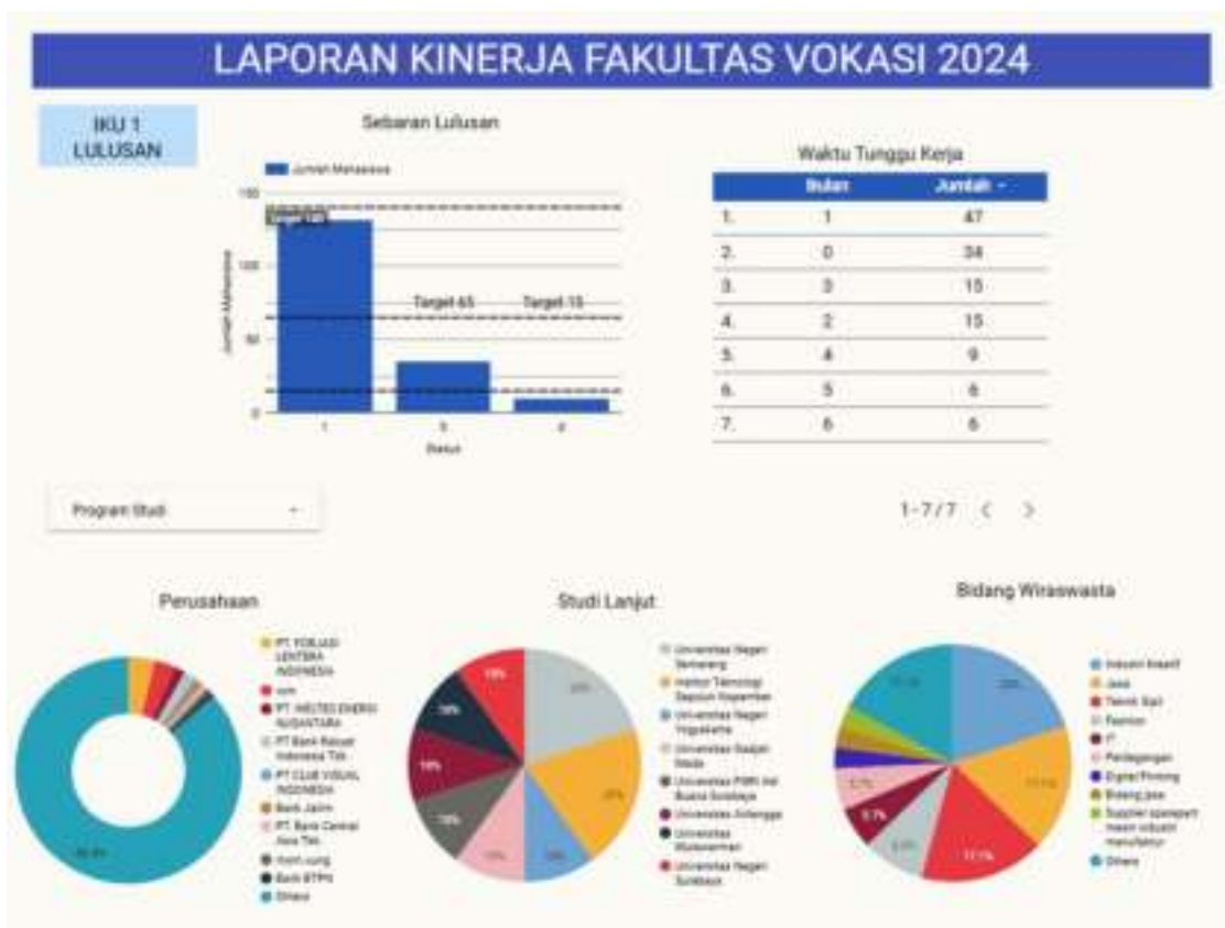
Gambar 1. 1 Capaian Indikator Kinerja Utama 1.1-1.3

Pertama, IKU 1 tentang Persentase lulusan S1 dan D4/D3/D2/D1 yang berhasil memiliki pekerjaan di Fakultas Vokasi Unesa Tahun 2024 sejumlah 132 mahasiswa dari target 140 mahasiswa (94,29 %) dan yang telah menjadi wirausaha sejumlah 35 mahasiswa dari target 65 mahasiswa (52,31%) serta yang melanjutkan studi sejumlah 10 mahasiswa dari target 15 mahasiswa (66,67%). Untuk data perusahaan tempat bekerja mahasiswa dapat dilihat pada lampiran, sedangkan perguruan tinggi tempat mahasiswa studi lanjut mayoritas di Institute Teknologi Sepuluh Nopember (ITS) dan Universitas Negeri Semarang. Untuk Bidang Wiraswasta sebesar 20% di industri Kreatif dan 17,1 % di bidang Jasa.