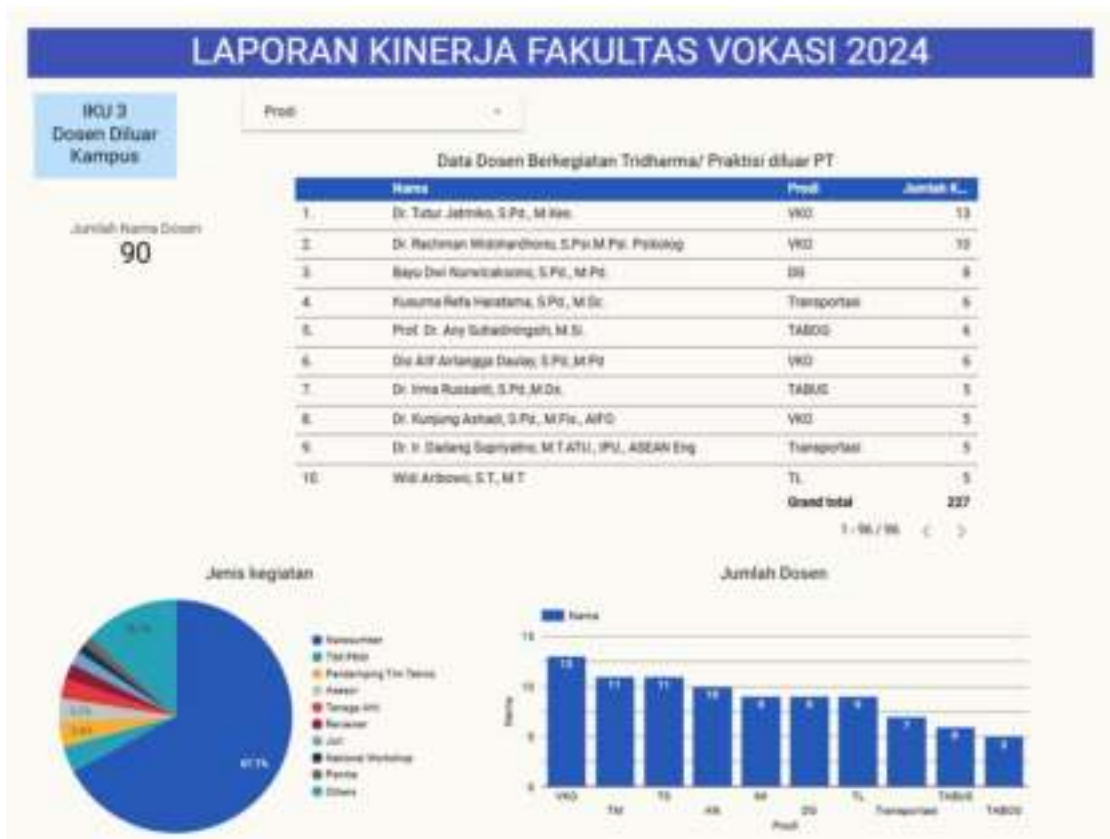
Gambar 1. 4 Capaian Indikator Kinerja Utama 3

Keempat, IKU 4 persentase dosen yang memiliki sertifikat kompetensi/profesi yang diakui oleh dunia usaha dan dunia industri atau persentase pengajar yang berasal dari kalangan praktisi profesional, dunia usaha, atau dunia industri. Dari data yang telah dikumpulkan, semua indikator pada IKU 4 tercapai dengan perolehan 96 dosen yang memiliki NIDN & NIDK bersertifikat kompetensi/profesi (115,66%) dimana skema sertifikasi terbanyak yang dimiliki dosen adalah Penulis Artikel Ilmiah dengan 11,3% di ikuti dengan Microsoft Office Specialist (MOS) - Work 2019 sebesar 5,6%. Kemudian untuk dosen praktisi didapatkan data 66 dosen flagship dari pemerintah (124,53%) yang berasal dari Praktisi Mengajar, serta 63 dosen flagship mandiri (143,18%) yang berasal dari pendanaan dalam prodi. Tidak ada kendala dalam pencapaian IKU 4 untuk data yang lebih lengkap dapat dilihat pada gambar 5.