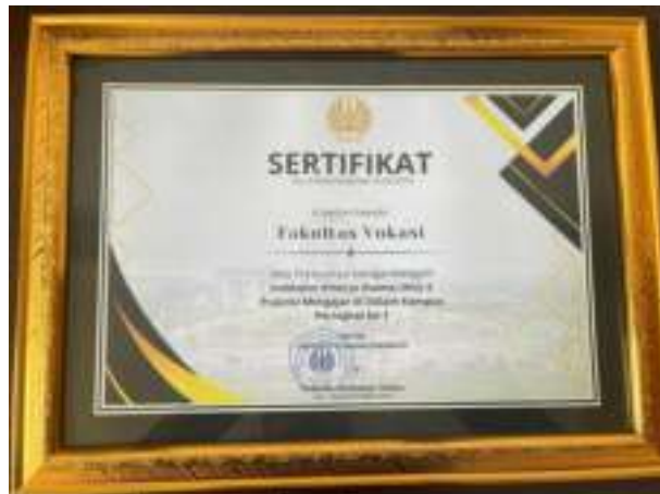
Gambar 3. 3 Peringkat ke-1 Praktisi Mengajar dalam Kampus