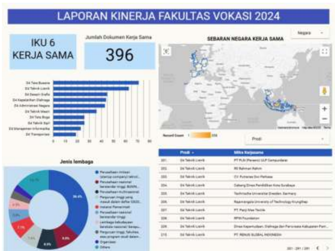
Gambar 1. 6 Capaian Indikator Kinerja Utama 6

yang diambil pada website scopus penerapan SDGs pada indikator 2 (Zero Hunger), 7 (Affordable and clean energy), 9 (Industry, innovation and infrastructure), 11 (Sustainable cities and communities). Hambatan pada penerapan SDGs 1 (No Poverty) adalah mayoritas indikator tersebut pada bentuk pengabdian kepada masyarakat sehingga artikel yang dihasilkan belum masuk kedalam Scopus. Untuk Impact Citation sudah melebihi target dengan jumlah 124 sitasi dari target 104 sitasi. Kemudian webometric telah mencapai 20000 trafik (100%) dari target 20000 traffic yang telah dilakukan adalah membentuk tim website dan volunter dari kalangan mahasiswa namun website Prodi Administrasi Negara mengalami kendala dengan data hilang. Fakultas Vokasi Universitas Negeri Surabaya (UNESA) selalu berupaya untuk mempromosikan keunggulannya di bidang pendidikan vokasi dan teknologi melalui berbagai kegiatan, salah satunya adalah pameran. Pameran yang di ikuti Fashion Exhibition Akbar, Brawijaya International Design Exhibition, Pameran Nasional Politeknik Bali Maha Werdhi dan Konaspi.