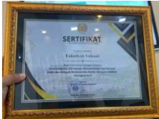
Gambar 3. 2 Penghargaan Zona Integritas