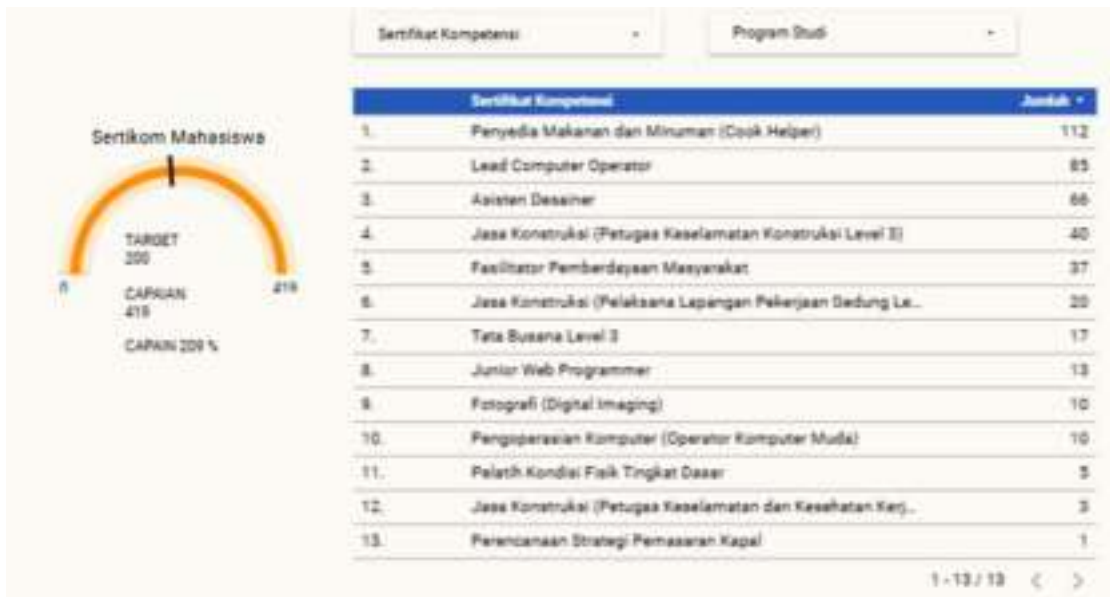
Gambar 1. 2 Capaian Indikator Kinerja Utama 1.4

Kompetensi sejumlah 419 mahasiswa dari target sejumlah 200 mahasiswa (209%) yang terdiri dari 10 Prodi. Tidak ada kendala dalam mengumpulkan data.