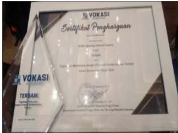
Gambar 3. 5 Organisasi Mahasiswa Terbaik