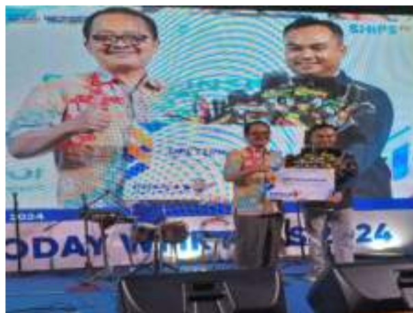
Gambar 3. 13 Dosen Pendamping Lapangan Terinspirasi Program Wirausaha Merdeka di PPNS