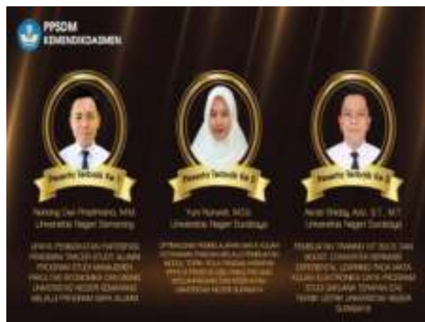
Gambar 3. 10 Peserta Terbaik ke 3 Latsar CPNS