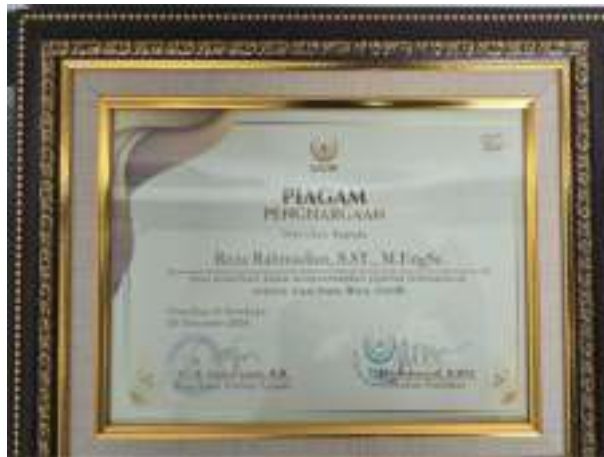
Gambar 3. 14 Penghargaan atas kontribusi

14. Penghargaan atas kontribusi dalam mengembangkan jejaring Internasional Sekolah Alam Insan Mulia (SAIM)