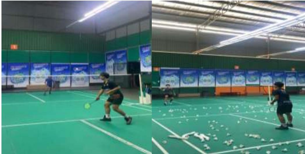
Gambar 2.5 Magang di Malaysia

Program magang ini dilaksanakan mulai tanggal 20 September – 31 Desember 2024 di Selangor, Malaysia. Magang ini dilaksanakan di Rommy Badminton Club (RBC) Central Park Dataran Sunway Kota Damansara. Mahasiswa diberi kesempatan magang selama 3 bulan.