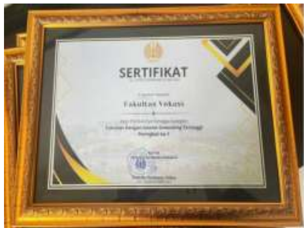
Gambar 3. 4 Income Gerating Tertinggi