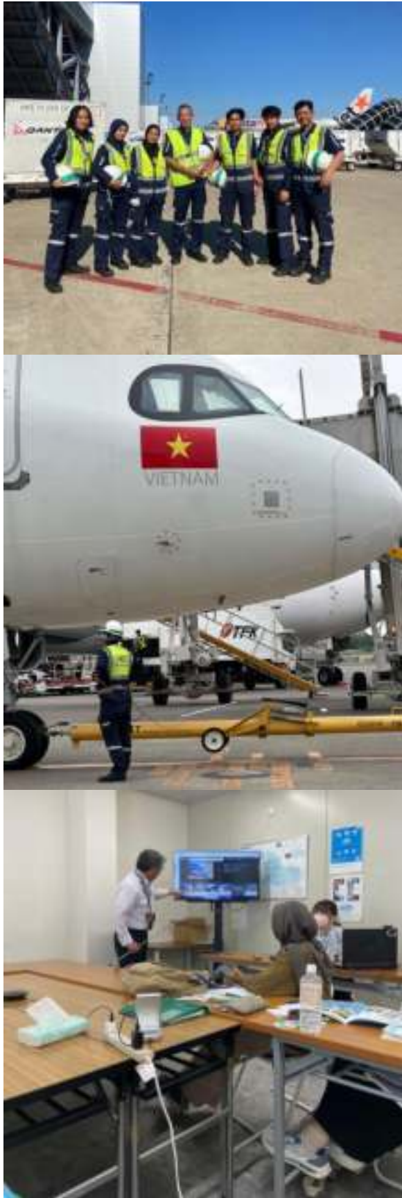
Gambar 2. 4 Magang International Mahasiswa