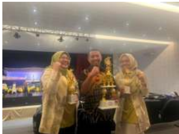
Gambar 3. 7 Juara Harapan Lomba Pantun