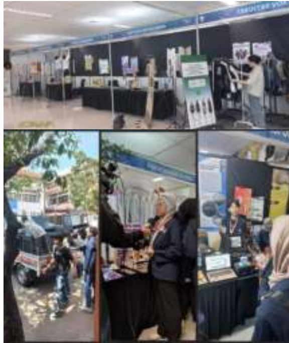
Gambar 2. 3 Kegiatan Pameran Fakultas Vokasi

yang telah mengikuti program PMW dan juga menampilkan karya program studi. Acara ini melibatkan 28 tim mahasiswa yang lolos pendanaan PMW Fakultas Vokasi, 2 tim lolos pendanaan PMW universitas, dan 11 prodi yang ada pada Fakultas Vokasi UNESA. Tujuannya adalah memperkenalkan dan mempersembahkan produk dan hasil karya, yang diharapkan mampu membuat masyarakat bisa lebih mengenal fakultas vokasi lebih luas. Expo Fakultas Vokasi tahun 2024 mengikuti serangkaian acara KONASPI XI tanggal 8-9 Oktober 2024.