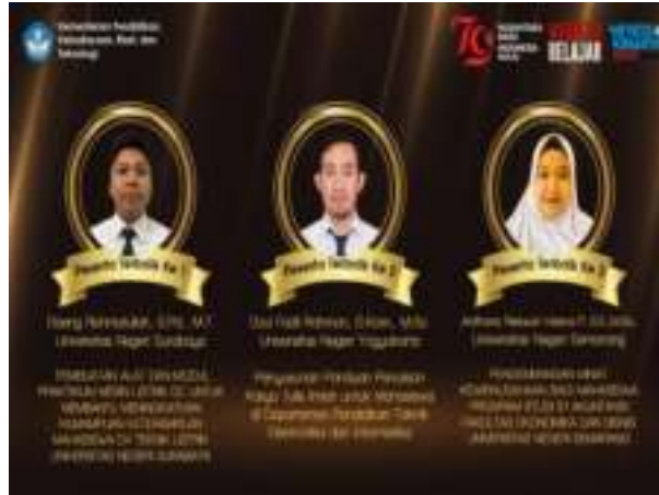
Gambar 3. 11 Peserta Terbaik ke 1 Latsar CPNS