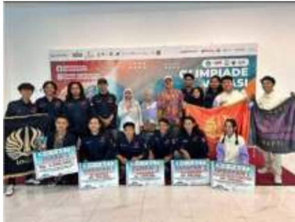
Gambar 2. 1 Prestasi Mahasiswa dalam Kompetisi Olivia