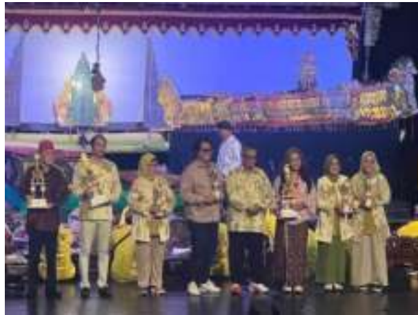
Gambar 3. 8 Juara Harapan 3 Nembang Macapat