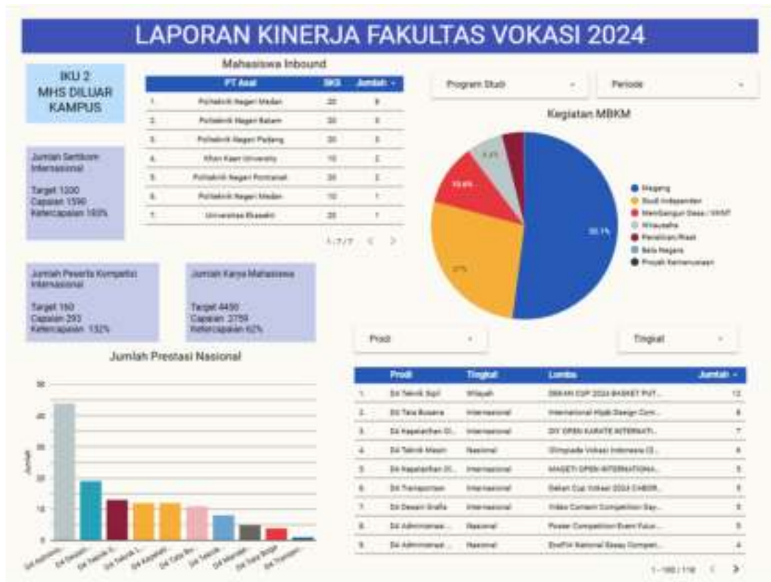
Gambar 1. 3 Capaian Indikator Kinerja Utama 2

Karya yang dihasilkan berupa poster, video, desain dll. Dari sisi persentase anggaran kegiatan mahasiswa sejumlah 19,85% dari total anggaran yang melebihi dari target 10%.