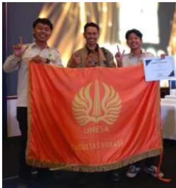
Gambar 2. 2 Penghargaan sebagai Organisasi Kemahasiswaan dalam Pemberdayaan Masyarakat 2024 Terbaik se-Indonesia

POMN adalah Program Ormawa Membangun Negeri. Program untuk memfasilitasi pembentukan kecakapan hidup ( life skill ) dan pengembangan karakter positif mahasiswa sekaligus membawa kemanfaatan kampus ke dalam masyarakat desa. POMN diselenggarakan oleh Kementerian Pendidikan, Kebudayaan, Riset, dan Teknologi Indonesia. Badan Eksekutif Mahasiswa (BEM) Fakultas Vokasi UNESA berhasil meraih penghargaan sebagai Organisasi Kemahasiswaan dalam Pemberdayaan Masyarakat 2024 Terbaik se-Indonesia pada tanggal 16 Desember 2024.