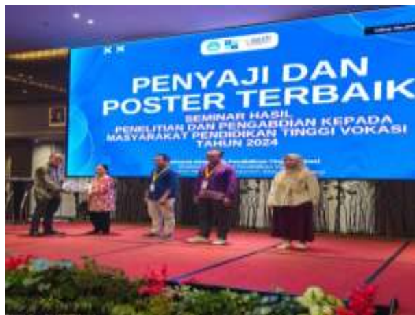
Gambar 3. 9 Penyajian Poster Terbaik