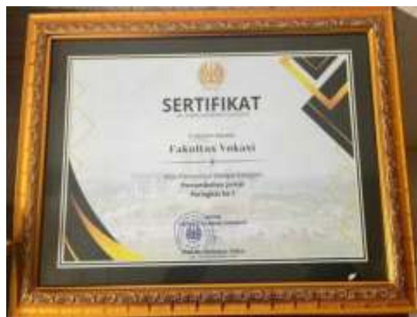
Gambar 3. 1 Penghargaan Pertumbuhan Jurnal