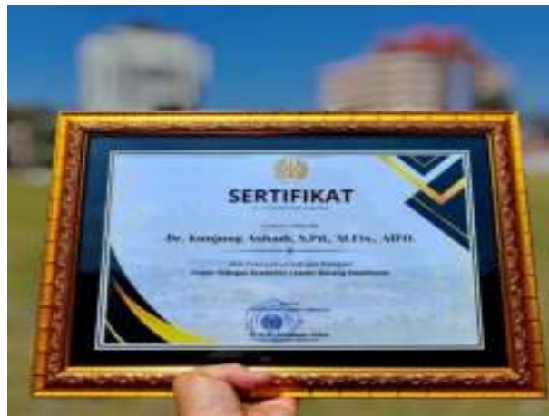
Gambar 3. 12 Dosen terbaik sebagai dosen Academic Leader Bidang Kesehatan