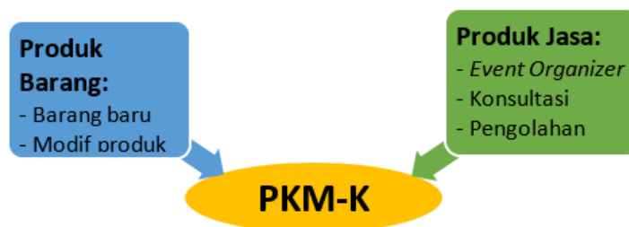
Gambar 1. Jenis komoditas PKM-K

Tim mahasiswa harus melakukan analisis adanya kebutuhan dan peluang pasar, untuk selanjutnya membuat kreativitas (komoditas) usaha dalam rangka menyediakan kebutuhan pasar tersebut. Komoditas usaha PKM-K dapat berupa barang atau jasa yang merupakan karya kreativitas yang menunjukkan kepakaran tim mahasiswa, sebagaimana pada Gambar 1. Komoditas usaha ini selanjutnya merupakan salah satu modal dasar mahasiswa dalam berwirausaha dan memasuki pasar. Komoditas tim PKM-K hendaknya tidak menjadi kompetitor produk sejenis yang merupakan sumber penghasilan masyarakat. Pelaku utama dalam berwirausaha ini adalah tim mahasiswa, bukan masyarakat, ataupun mitra lainnya. PKM-K tidak semata-mata berorientasi pada perolehan laba ( profit ), akan tetapi lebih mengutamakan pada kemanfaatan dan kreativitas produk berbasis iptek serta kualitas pelaksanaan usahanya.