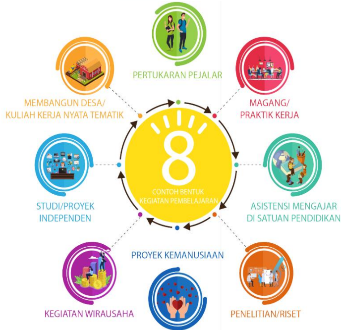
Gambar 2. Kegiatan pembelajaran sesuai Permendikbud No 3 Tahun 2020 Pasal 15 ayat 1