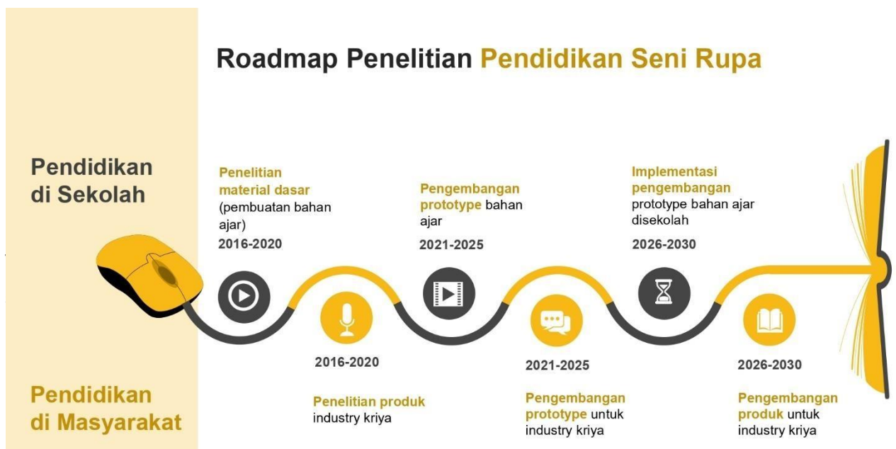
Gambar 3: Roadmap Penelitian Prodi Pendidikan Seni Rupa

Setelah melakukan pengkajian visi, misi, tujuan dan strategi Program Studi Pendidikan Seni Rupa dirumuskan konsep pemetaan bidang ilmu Seni Rupa menjadi dua, yaitu Seni Rupa Murni yang terbagi menjadi fokus kajian seni dan fokus penciptaan karya seni. Sedangkan untuk pendidikan Seni Rupa terbagi menjadi fokus pendidikan seni rupa di sekolah dan pendidikan seni rupa di masyarakat. Adapun roadmap penelitian program studi seni rupa sebagai berikut: