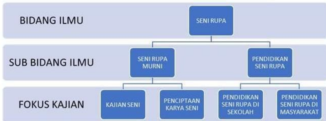
Gambar 2: Pemetaan Bidang Ilmu Seni Rupa

Dari visi, misi, tujuan dan strategi Program Studi Pendidikan Seni Rupa dirumuskan konsep pemetaan bidang ilmu yaitu: