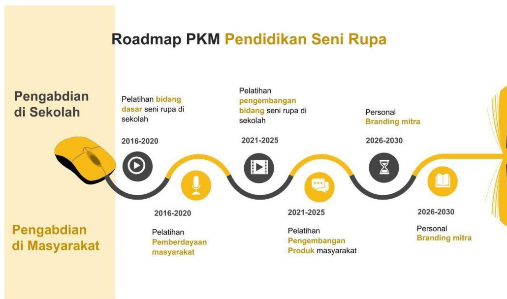
Gambar 2.1: Roadmap PKM Prodi Pendidikan Seni Rupa

Program studi Pendidikan Seni Rupa memiliki roadmap pengabdian kepada masyarakat(PKM) yang searah dengan roadmap PKM. Hal tersebut dikarenakan setiap program PKM merupakan turunan dari hasil PKM yang disesuaikan dengan kebutuhan masyarakat. Berikut adalah roadmap PKM yang telah disusun oleh Program studi Pendidikan Seni Rupa: