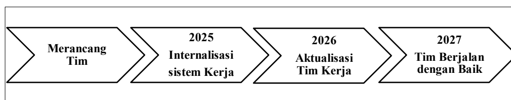
Gambar 3. Internalisasi kinerja Tim Prodi Doktor Pendidikan Ekonomi

Dalam mewujudkan visi dan renstra Prodi Doktor Pendidikan Ekonomi, Korprodi membentuk task force yang solid melalui ketua tim kerja yang memudahkan untuk berkoordinasi dan menampung ide atau inovasi dari anggota tim sehingga terjalannya rasa saling menghormati antar tim yang ada untuk mencapai kesuksesan prodi Doktor Pendidikan Ekonomi. Adapun tahap perencanaan sampai dengan pelaksanaan yang secara efektif dari masing-masing tim ditunjukkan dalam gambar 3 di bawah ini.