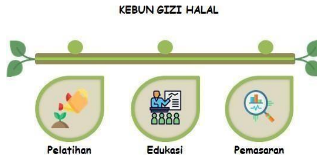
Gambar : Konsep Kebun Gizi Halal

Masalah kurang gizi dalam masyarakat merupakan masalah yang cukup pelik dan tidak mudah penanganannya. Pada umumnya penyakit kekurangan gizi (malnutrisi) merupakan masalah kesehatan yang menyangkut multidisiplin dan selalu harus dikontrol terutama masyarakat yang tinggal di negara-negara berkembang. Bahkan di Indonesia, tahun 2015 saja ditemukan 26.518 balita yang menderita gizi buruk (Depkes, 2015). Berawal dari keprihatinan terhadap kondisi ini, maka Kebun Gizi Halal merupakan solusi. Kebun Gizi Halal merupakan perkebunan dengan konsep tanaman yang memiliki nilai gizi tinggi, bernilai ekonomis, dan juga halal bagi manusia. Tanaman yang dimaksud adalah sejenis tanaman pangan hortikultura dan bahan makanan pokok, meliputi sayuran, buah-buahan, tanaman herbal, padi serta tanaman lain. Harapan dengan adanya program ini semakin banyak masyarakat yang bisa mengonsumsi makanan bergizi. Berikut adalah konsep Kebun Gizi Halal dan aspek sasarannya.